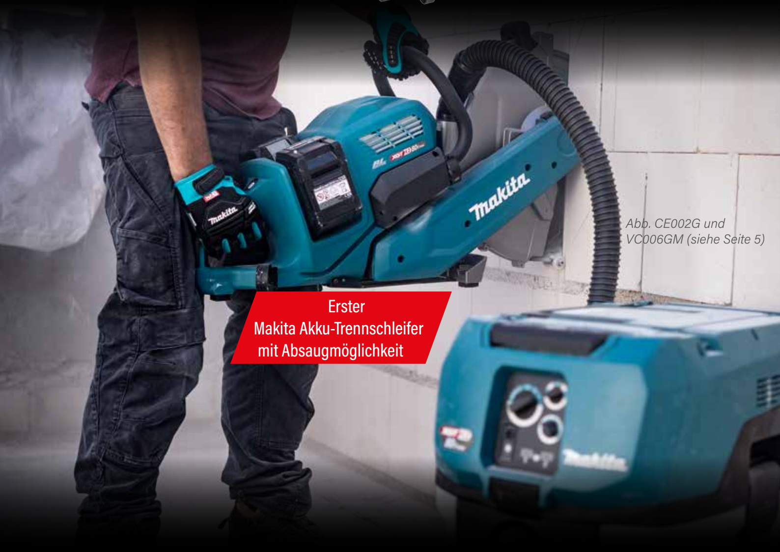
Abb. CE002G und VC006GM (siehe Seite 5)

Diamantscheibe im Lieferumfang abweichend